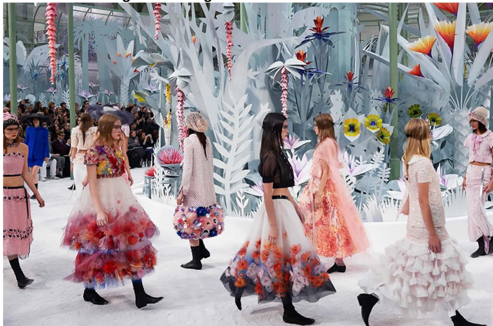
Figura 3: Cenografia nos desfiles de moda.

Estas são características absolutamente subjetivas que ganham concretude no momento do desfile, ao serem comunicadas para uma plateia. Ao adentrar numa sala de desfile o público é convidado a ‘deixar’ o cotidiano e ‘ingressar’ em um novo espaço, um mundo utópico, repleto de ineditismo e pronto a oferecer experiências extraordinárias.