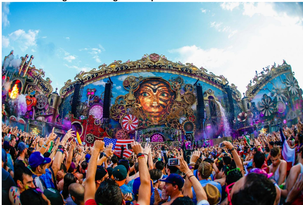
Figura 1: Cenografia de palco no Tomorrowland.

A cenografia tanto no cinema quanto na televisão solicita do arquiteto cenográfico um olhar conceitual atento, que se entende aos pequenos detalhes que compõem o cenário de fundo, e remete o espectador ao lúdico abstrato, passando para as cenas, a sensação que deseja transmitir. Hoje é considerada um ato criativo, aliado a conhecimento de técnicas e teorias específicas que têm o objetivo de organizar o lugar teatral e nele se estabelecer uma relação entre cena e público (figura 1).