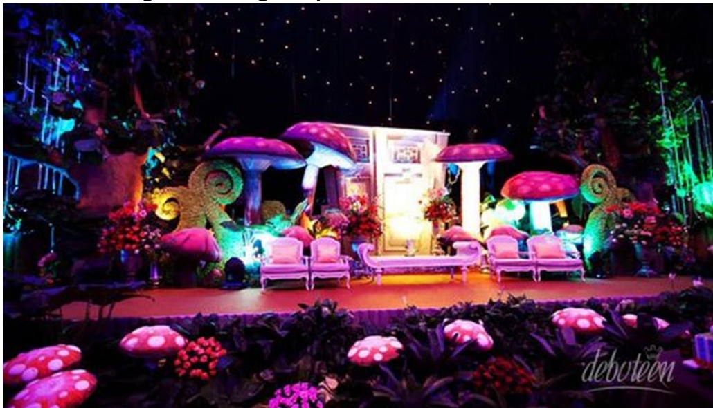
Figura 5: Cenografia presente em festa de 15 anos.