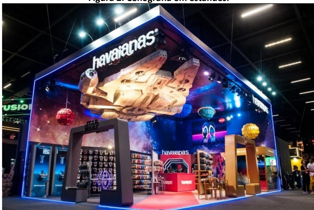
Figura 2: Cenografia em estandes.

A operação de produção do espaço do estande implica na identificação do público alvo, na qualificação dos objetivos da comunicação pretendida pelo cliente e, conseqüentemente, na elaboração desta mensagem através de um projeto cenográfico. O tamanho do espaço adquirido e a sua localização na planta da feira, assim como o período de duração são as informações iniciais na orientação de um projeto. As soluções a serem adotadas para a exposição mais eficaz de um produto ou serviço implicam inicialmente no impacto visual que o estande desperta no visitante-passante, em meio a um ambiente também ocupado pela concorrência, espaço onde todos têm por objetivo apresentar a mensagem mais atraente e confiável.