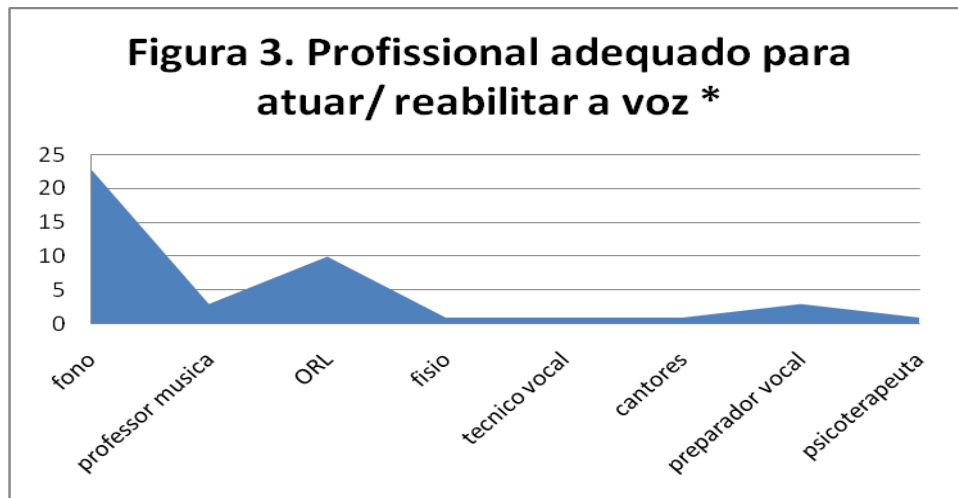
Tabela 4: Conhecimento sobre o papel do fonoaudiólogo no processo de aquecimento e desaquecimento vocal.