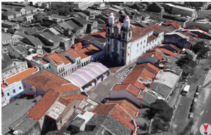
Figura 2 – Vista isométrica esquemática do pátio de São Pedro.