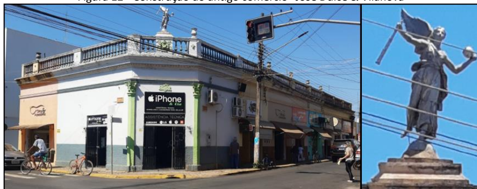
Figura 12 - Construção do antigo comércio “José Dulce & Vilanova”