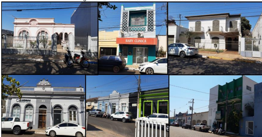
Figura 6 - Casas existentes na rua João Pessoa