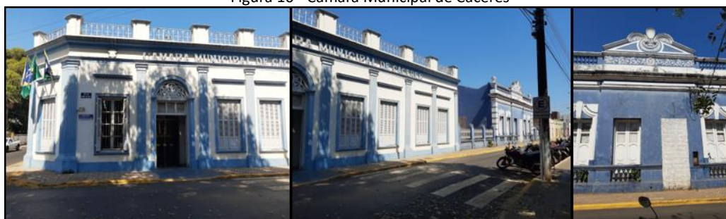
Figura 10 - Câmara Municipal de Cáceres