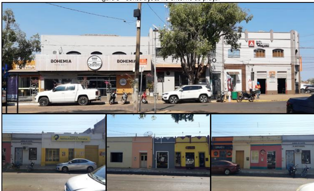
Figura 5 - Construções no entorno da praça.

O entorno da praça é rodeado por algumas casas do período colonial que apresentam grandes modificações estruturais (figura 5); em muitos casos, tendo a fachada completamente modificada; alguns mantêm originais os vãos das portas e janelas, porém com esquadrias substituídas por modelos atuais, como podem ser vistas nas fotos abaixo.