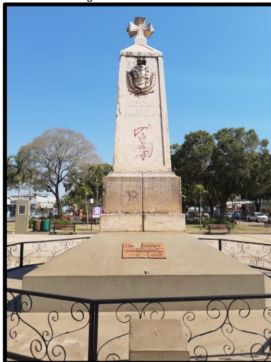
Figura 2 - Marco do Jauru

A caminhada teve início na Praça Barão do Rio Branco onde está localizada a Igreja Matriz de São Luiz de Cáceres. Neste ponto da cidade três elementos chamam a atenção, o primeiro é o rio Paraguai, bem em frente à praça, pode-se chegar na beira do rio por uma escadaria que dava acesso ao antigo porto, onde hoje ficam aportadas as chalanas; o segundo elemento é o Marco do Jauru, que delimitou as terras de domínio português depois da assinatura do Tratado de Madri, em 1750; o terceiro elemento é a igreja matriz de características neogóticas (figura 3 e 4).