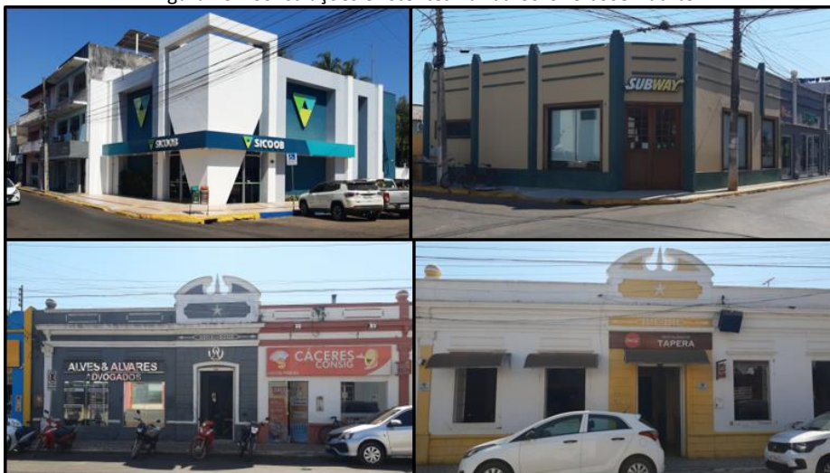
Figura 13 - Construções existentes na rua Coronel José Duarte