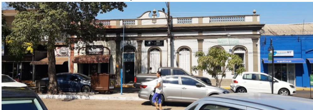
Figura 7 - Construções existentes na rua Antônio Maria

Chegando na praça Major João Carlos o trajeto continua na rua Antônio Maria até a avenida General Osório. Neste trajeto o cenário é semelhante ao anterior, os estilos arquitetônicos se misturam (figura 7), chamando a atenção ao antigo prédio do museu histórico de Cáceres, que se encontra abandonado (figura 8).