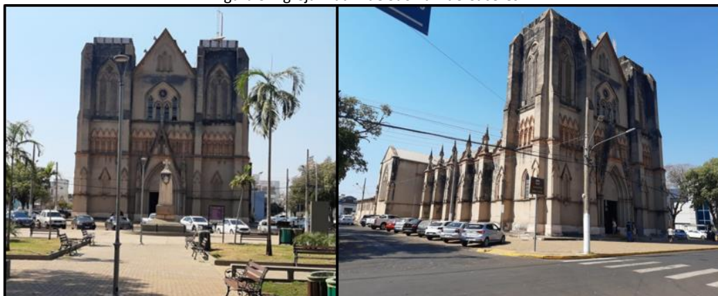
Figura 3 - Igreja matriz de São Luiz de Cáceres