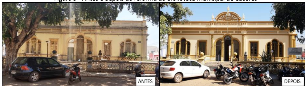
Figura 9 - Antes e depois da reforma da Biblioteca Municipal de Cáceres

Prefeitura Municipal de Cáceres) que foi reformada em 2022 e a Câmara Municipal de Cáceres datada de 1893. Ao lado da Câmara existe uma construção que se encontra abandonada, no entanto nota-se um certo cuidado com ela, pelo menos com a pintura.