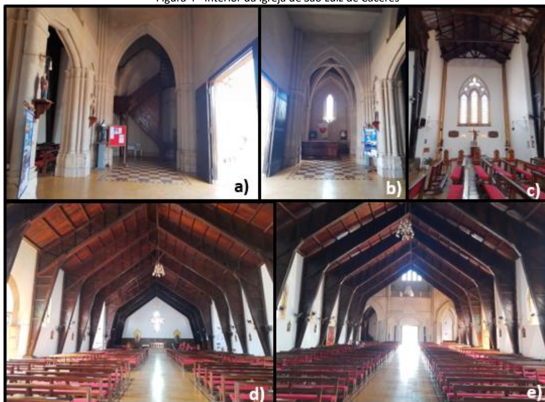
Figura 4 - Interior da igreja de São Luiz de Cáceres

Legenda: a) vista do lado direito do átrio, escadaria para a torre do sino; b) vista do lado esquerdo do átrio; c) lado direito do transepto; d) vista da nave central com ênfase no altar; e) vista da nave central com ênfase para a entrada principal.