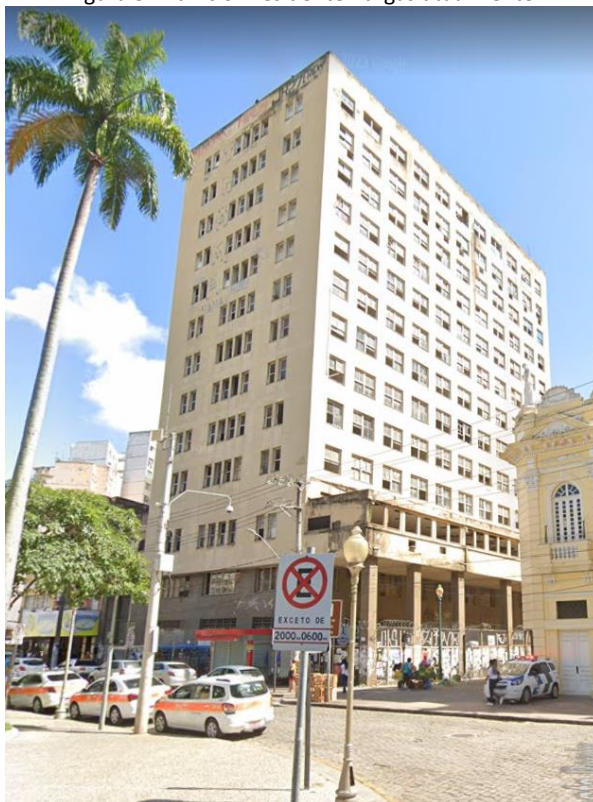
Figura 3 - Edifício Presidente Vargas atualmente.