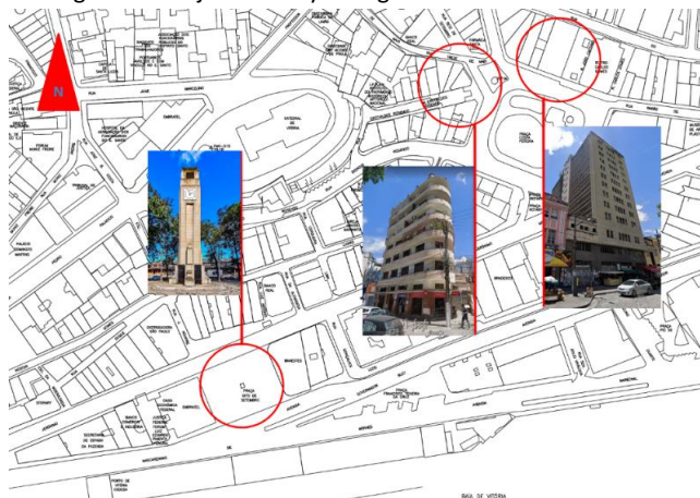
Figura 2 - Projetos de Jayme Figueira no Centro de Vitória