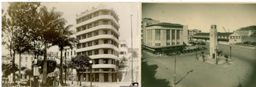
Figura 1 - Edifício Antenor Guimarães e Relógio da Praça Oito de Setembro