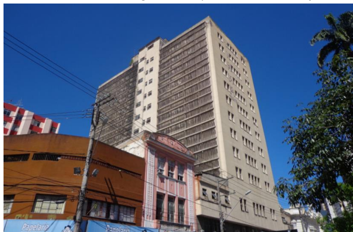
Figura 5 - Edifício Presidente Vargas fachada posterior, com a inserção dos brises.

No projeto proposto, o Edifício do IAPI, de planta retangular, seria destinado a abrigar noventa apartamentos com dois quartos cada. Atualmente, a propriedade pertence ao patrimônio da União, e as negociações incluíram o envolvimento do Movimento dos Sem Teto. Caso a União decida doá-lo à Prefeitura de Vitória, esta ficaria encarregada de realizar a obra. No entanto, a distribuição das unidades habitacionais seria feita da seguinte forma: metade delas seria destinada a moradores selecionados pela prefeitura (50%), enquanto a outra metade seria disponibilizada para membros do movimento.