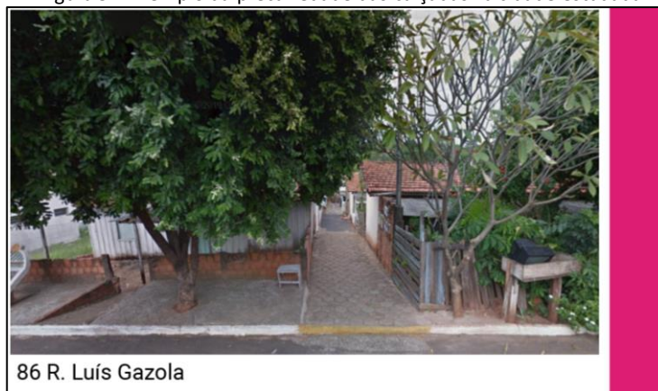
Figura 5 – Exemplo da precariedade das calçadas na cidade estudada

A averiguação das calçadas, como elucidado na tabela, evidencia uma triste realidade imposta no meio urbano: o principal espaço dedicado à circulação de pedestres é extremamente degradado. Problema que afeta a mobilidade urbana e impõe restrições à tão fundamental urbanidade (Figura 05).