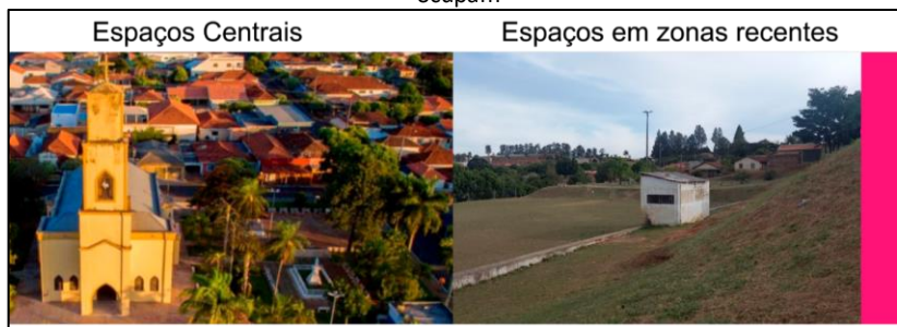
Figura 7 – Discrepância da qualidade dos espaços públicos livres da cidade analisada conforme a localização que ocupam

Apesar da maior quantidade de praças ou parques nas áreas de expansão urbana, estes são insuficientes no quesito qualidade, visto que possuem pouquíssimos equipamentos de apoio como, por exemplo, mobiliário urbano e escassos exemplares de massa vegetal, o que acaba inibindo os usos e fomentando os processos de abandono. São os espaços públicos livres localizados nas regiões centrais que atraem para si uma maior quantidade de usos. Por se tratar dos primeiros espaços públicos livres da cidade, muitos implantados nos primórdios da formação urbana - como as praças no entorno da igreja matriz- bem como pela localidade que ocupam - rodeados pelo comércio local, prédios públicos e religiosos - esses espaços expõem os laços afetivos relacionados ao pertencimento e a memória dos cidadãos, fazendo inclusive, parte ativa da identidade da cidade (Figura 7).