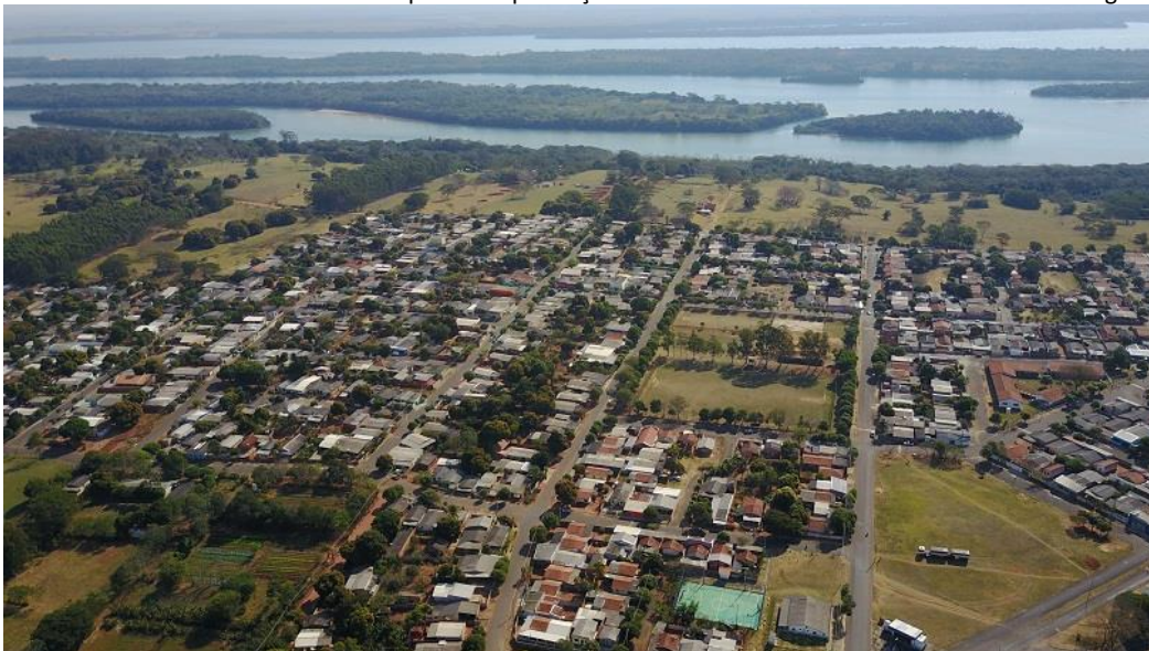
Figura 1 - Município de Rosana-SP: com população estimada de 15.928 habitantes, a cidade conta com duas usinas hidrelétricas. As usinas contribuíram para a implantação de universidades e estimulou o turismo na região