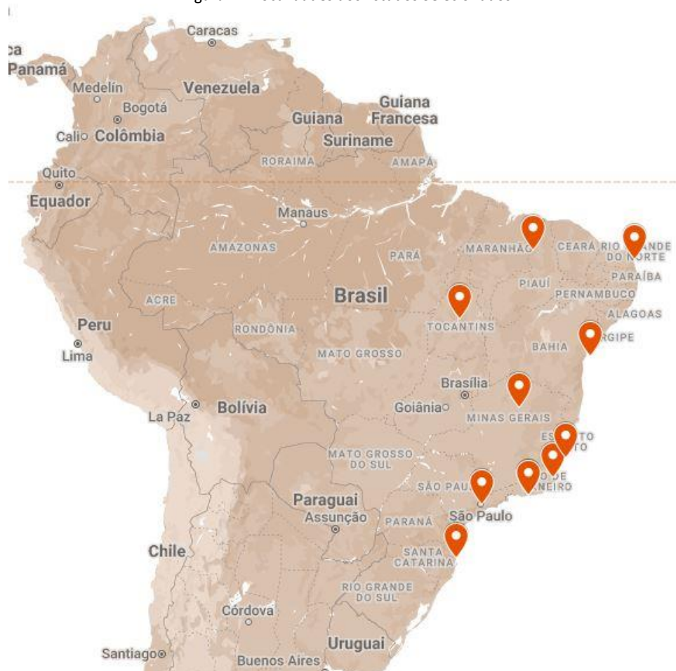
Figura 2 – Localidades dos Estudos Selecionados

Os estudos selecionados abrangeram espaços públicos nas regiões Sudeste (6) (Nagano e Gonçalves, 2018; Carvalho e Pacheco, 2019; Lettieri e Santos, 2019; Batista e Bortolo, 2022; Tângari, 2022; Santos e Botechia, 2023), Nordeste (3) (Matos et al. , 2014; Carvalho e Ataíde, 2019; Coité, 2020), Sul (1) (Machado e Reis, 2020) e Norte (1) (Oliveira e Menezes, 2018), não sendo identificado nenhum estudo da região Centro-Oeste que atendesse aos requisitos de seleção. A Figura 2 ilustra as localidades dos estudos encontrados.