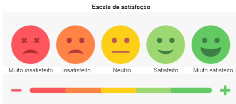
Figura 2 — Ilustração da escala de satisfação utilizada nas entrevistas.

Na sequência, o entrevistado foi questionado quanto às mudanças no seu cotidiano e no de sua família. Neste momento buscou-se verificar aspectos relacionados à transformações na qualidade de vida do beneficiário e de sua família desde a implantação do banheiro a partir de uma pergunta aberta.