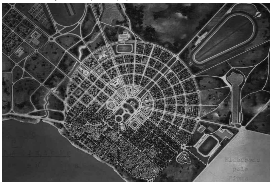
Figura 1 – Maquete do projeto urbanístico de Boa Vista/RR