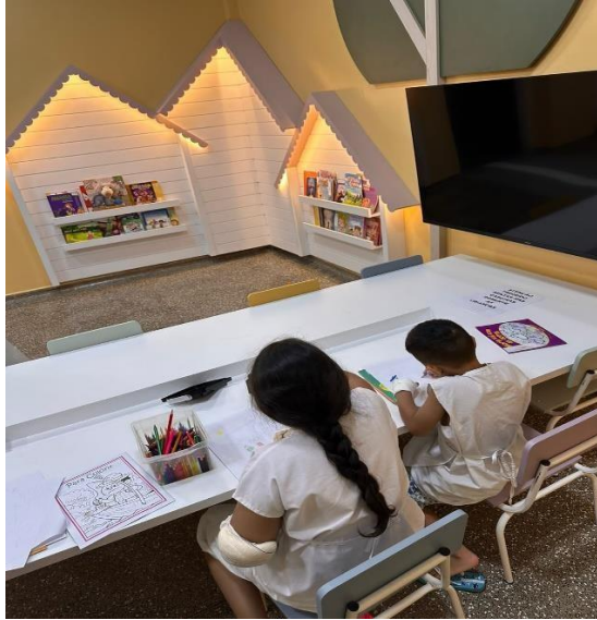
Imagem 2: Atividades de recreação pelo Projeto brincar na brinquedoteca do Hospital Regional de Cáceres Dr. Antônio Fontes (HRCAF)

No cenário em que houver alguma criança que não pode ser incluída nas atividades realizadas, os voluntários do projeto juntamente com os profissionais enfermeiros, devem elaborar algum exercício lúdico para aquela criança. Dessa forma todos os pacientes irão ter a experiência de brincar para poder curar.